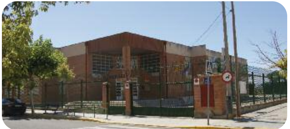
El Gobierno de Aragón adeuda, desde el año 2011, al Ayuntamiento de Utebo los costes de limpieza, energía eléctrica y gas de los cuatro colegios públicos del municipio.