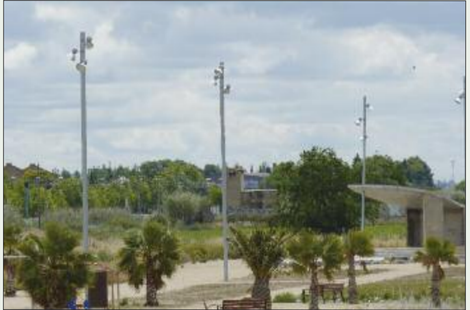
Imagen del parque tal y como quedó tras los trabajos de Mariano López Navarro y que nada tiene que ver con el parque tal y como ha quedado ahora finalizado.

Para la finalización de los trabajos, según el proyecto aprobado en el año 2008 y que no ha podido sufrir ningún tipo de modificación, ha sido necesario llevar a cabo también la demolición de algunos elementos, así como la construcción de otros elemen-