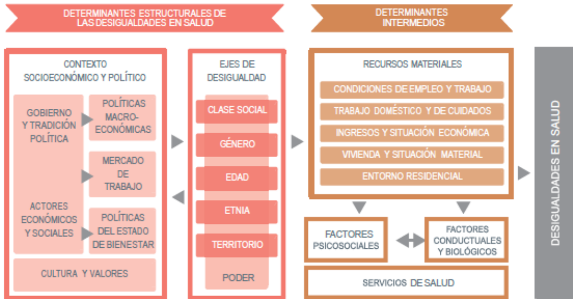
Figura 2. Marco conceptual de los determinantes de las desigualdades sociales en salud