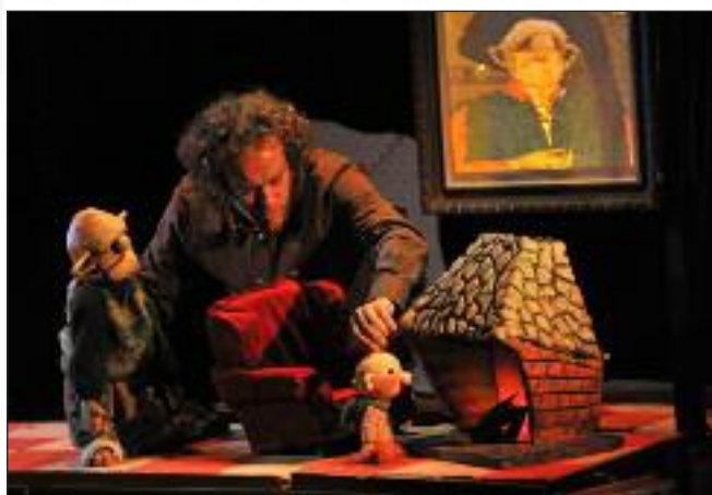
Un momento de la representación "Peus de Porc".